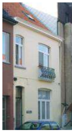
▼ Poverello Tielt, Nieuwstraat 19