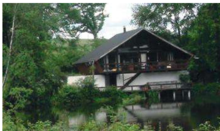
▼ Site de camp dans les Ardennes