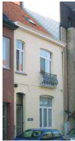
▼ Poverello Tielt, Nieuwstraat 19