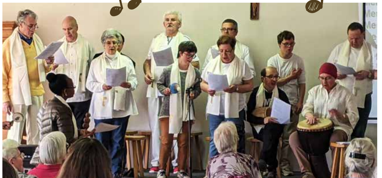
Het koor van Poverello Banneux tijdens de lunch van de Banneuxdag.

In Poverello zijn we soms druk bezig met heel concrete taken en zorgen. Aardappelen afhaken, een lek in een dak repareren, een zieke of dakloze nabij zijn. Toch wil ik deze gedachte met jullie delen omdat ze bevrijdend is en iets essentieels wakker maakt. Want door even zo uit te zoomen, zien we niet alleen de nietigheid, maar ook het bijzondere van elke mens. En het maakt duidelijk dat we daarin lotgenoten zijn