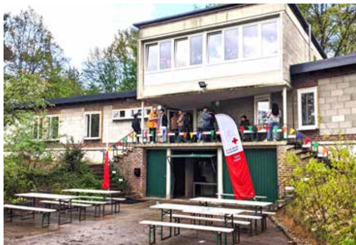
Het gerenoveerde SIBO huis biedt sinds mei dit jaar een thuis aan minderjarige vluchtelingen.

*) In het volgende krantje zal een groter artikel opgenomen worden over het ontstaan van de samenwerking tussen SIBO en Poverello, haar geschiedenis en hoe we nu naar de toekomst kijken.