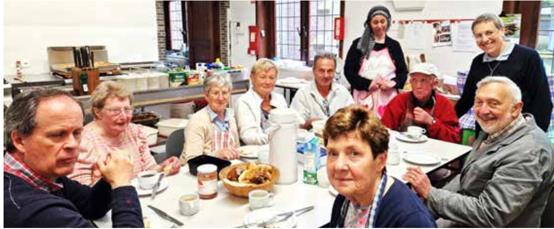
De maandagploeg van Kortrijk in de keuken.