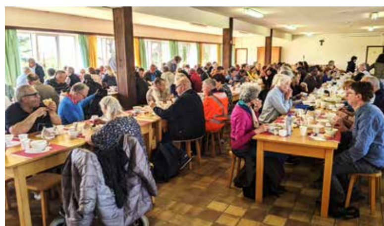
Picknick in Poverello Banneux.