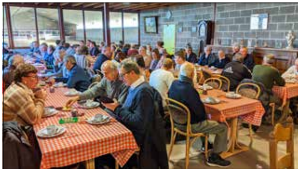
Kerst in Tielt