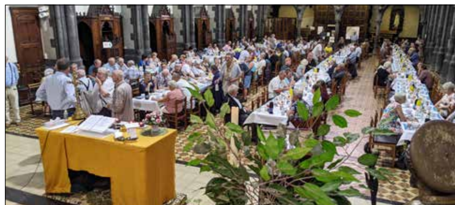
Zeedag Oostende augustus '22

* De vereniging: 'For a Better Life' zal samen met haar sponsors weer instaan voor een lekker ontbijt en een warme maaltijd.