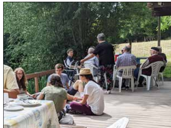
Jaarmis juli '22