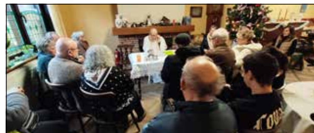
Kerst in Ronse