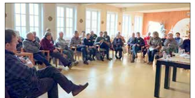
Samen zoeken... Vormingsdag januari '23

Aan deze vorm van op weg gaan is een grote nood in Poverello! Het is een taak uitoefenen (eten koken, maaltijden opdienen, koffie schenken, afwassen,