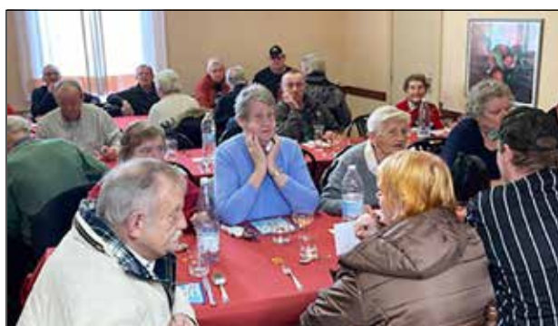
Kerst in Gent

Het Kerstfeest is goed en wel verlopen. 74 praatgrage gasten met grote honger. De pannenkoeken van de "Nieuwe Wandeling" koks waren allemaal op. Er was ambiance! Beste wensen voor het nieuwe jaar! Ivan