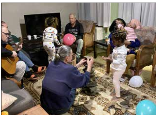
Nieuwjaar in Zottegem

Corona heeft Poverello Zottegem meegenomen op een nieuw pad. Het komen en gaan van het gastenhuis dat we voor corona waren, kwam door de maatregelen tot stilstand. Maar er ontkiemde tegelijk een nieuw plantje. Het huis werd tijdelijk een thuis voor een aantal mensen uit Brussel die onder deze rare omstandigheden een vaste woonplek nodig hadden. In deze periode van 'beperkingen' leefden we daar eigenlijk wonderlijk vrij. We waren een bubbel met elkaar en hadden geen gebrek aan 'samen'. Met het platteland en eigen buitenterrein om ons heen was er volop ruimte om te gaan en staan. Wat een geschenk! Maar er was meer. We ontdekten dat dit leven als vaste gemeenschap een eigen kracht had. Voor een aantal gasten was het precies wat ze eigenlijk nodig hadden. Ook het ontvangen van logees werd anders nu ze in een vaste groep 'thuis' konden komen. We besloten ook na corona dit pad te blijven volgen. Inmiddels bewonen we met zeven het woonhuis als een gemeenschap. Met elkaar zorgen we voor het gezamenlijk leven en de (moes)tuin. In het gerenoveerde deel van het retraitshuis op ons terrein, verblijven sinds oktober een negental Oekraïeners. Een mooie groep door wie wij zelf vaak warm als gast onthaald worden. Een Afrikaans vluchtelingen-gezin met jonge kinderen maakt tenslotte ons kleine 'wereldorpje' compleet.