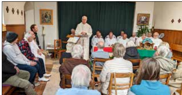
Kerstfeest in Kortrijk

Wat een avontuur de voorbije twee jaar in Kortrijk! Een gans nieuwe opstart in een gigantisch klooster, doorheen corona en de mediacrisis. Toch vonden we in het onthaal snel ons ritme, en voelen we ons al helemaal thuis. We hebben nu ruimte, parking en een nieuwe keuken. Wel komt er veel werk bij aan het grote gebouw en de tuin. Onze 45 vrijwilligers verwelkomen rond de 60 gasten, die blij zijn dat er meer rust en een tuin is. En verzorgde kledij. Verder passeren er heel wat groepen en stagiairs en allen zijn positief onder de indruk van de goede sfeer, de propere keuken en het mooie werk. Nieuw zijn de mannen die boven logeren, op dit moment een 8-tal. Soms een uitdaging, maar we werken toe naar een mooie groep die zich hier thuis voelt. Ook de werken in de vleugel voor de gemeenschap vorderen. Al botsen we soms op onze beperkingen, we mogen zeggen dat het hier goed gaat!