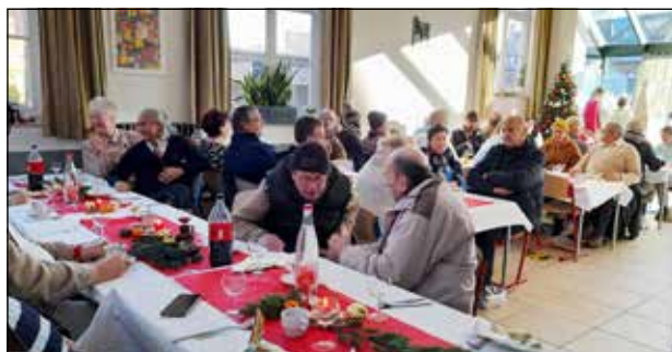
Kerst in Tongeren