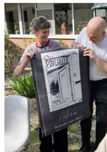
Gert neemt afscheid... én blijft een beetje!

Poverello zit in een spreekwoordelijke put en ik hoop van harte dat ze daar mag uitgeraken. Dat Poverello terug