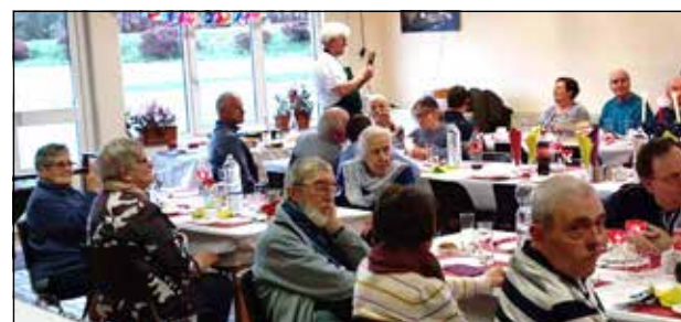
Nieuwjaar in Banneux