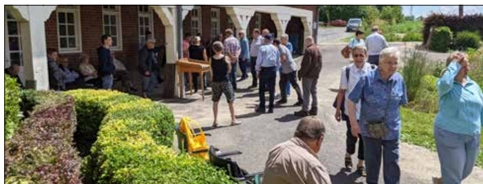
Sint Antoniusfeesten Zottegem juni '22

Ter info voor personen in de omgeving van Zottegem: Sinds decennia is er elke dinsdag een Eucharistieviering om 18.30u. Vanaf dinsdag 18 april wordt gedurende negen dinsdagen het jaarlijks noveen gebeden ter ere van de H. Antonius. De Eucharistieviering begint dan om 19u. Sinds kort is er elke 2e zondag van de maand van 14:30 - 17:30 een gezellige inloop met koffie, gebak, ontmoeting en spelletjes. Van harte welkom!