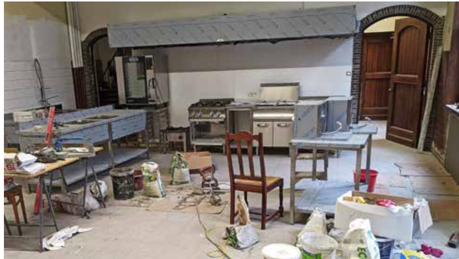
Plaatsing van de keuken in Kortrijk.