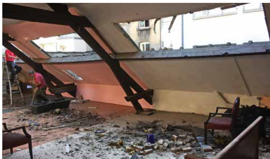
Een nieuw dak op ons huis in de Fonsnylaan (Brussel).