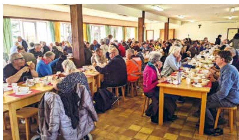
Picque-nique au Poverello Banneux.