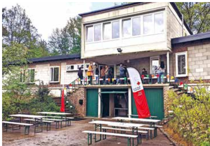
La maison rénovée du SIBO accueille des réfugiés mineurs depuis le mois de mai de cette année.

*) Dans la prochaine Gazette, il y aura un article plus long sur l'origine de la collaboration entre SIBO et Poverello, son histoire et comment nous envisageons maintenant l'avenir.