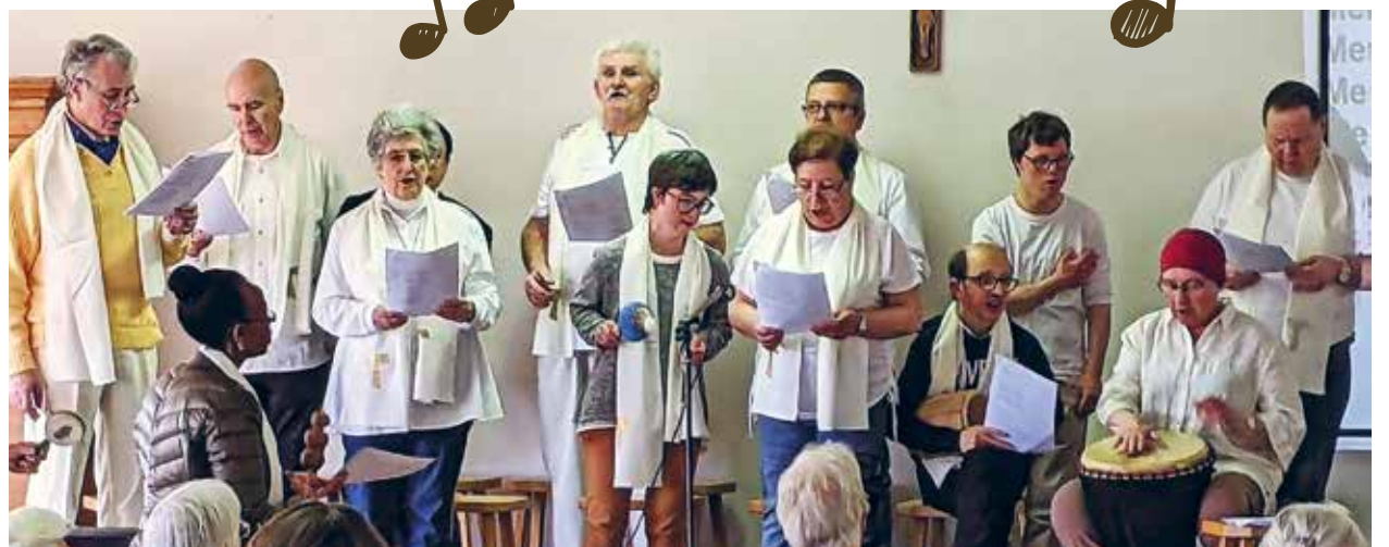
La chorale du Poverello Banneux lors du lunch de la Journée à Banneux.

Au Poverello, nous sommes parfois fort occupés par des tâches et des préoccupations très concrètes. Se procurer des pommes de terre, réparer une fuite dans un toit, être proche d'une personne malade ou sans-abri. Pourtant, je veux partager cette pensée avec vous parce qu'elle libère et réveille quelque