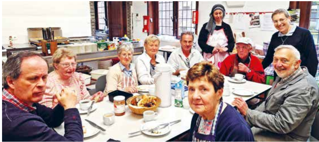
L'équipe du lundi de Courtrai dans la cuisine.